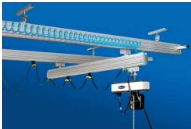
Lettbanetravers i aluminium inkludert elektrisk kjettingtalje