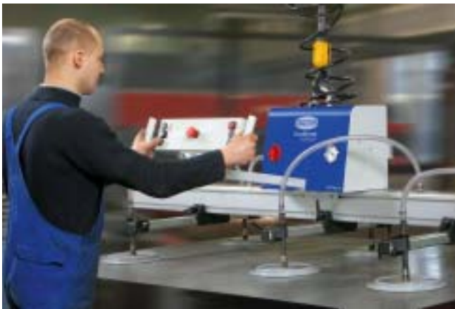
VacuMaster Comfort, 750 kg, horisontal