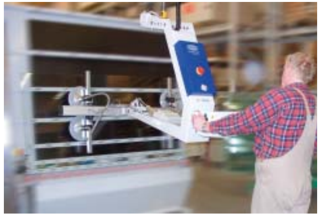
VacuMaster Comfort, 125 Kg, 180 grader vending av glasser i rengjøringsmaskin