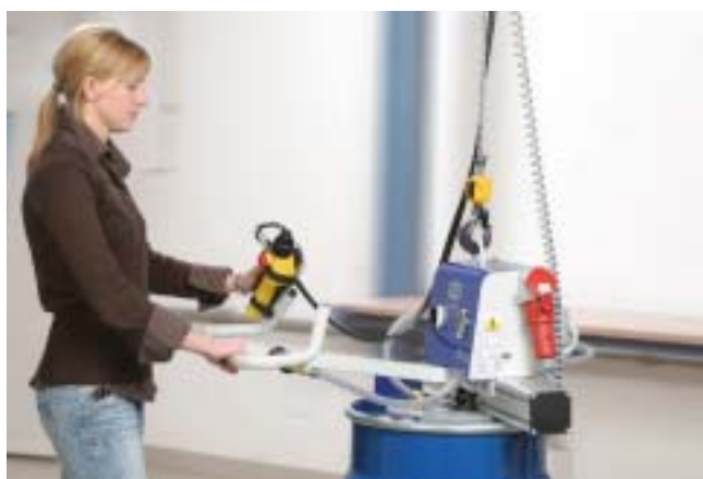
VacuMaster Basic, 250 Kg, horisontal håndtering av tønner