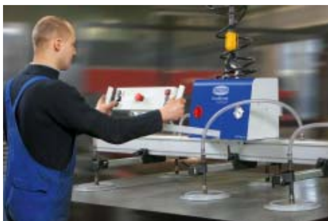
VacuMaster Comfort, 750 Kg, horisontal håndtering av stålplater