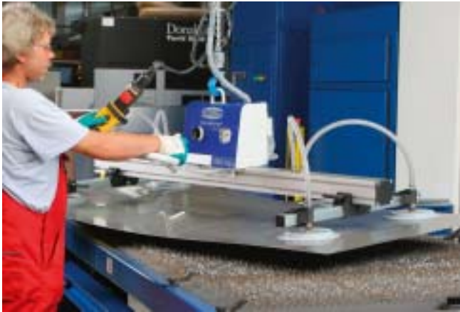
VacuMaster Basic, 250 kg, horisontal

Basis og high end konfigurasjoner med integrerte funksjoner