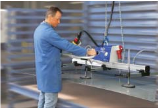
VacuMaster Basic, 250 Kg, horisontal håndtering av plater inn og ut av plateskuffer