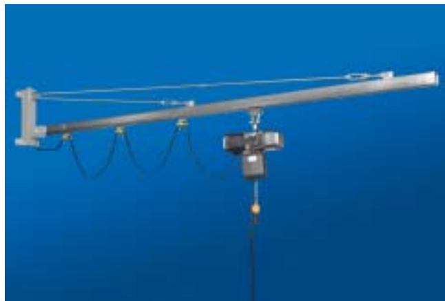
Veggsvingkran med elektrisk kjettingtalje