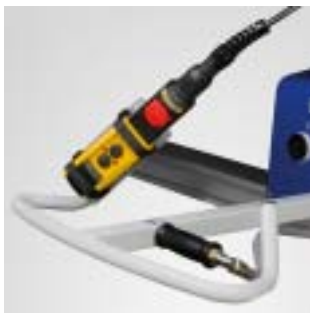
Operatørhåndtak VacuMaster Basic