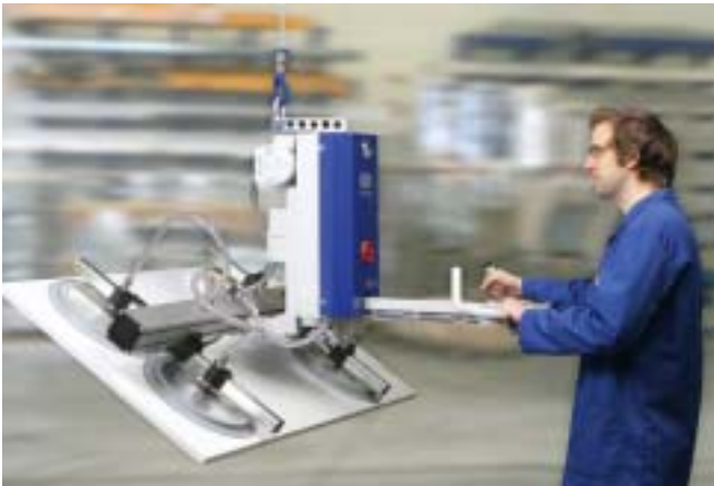
VacuMaster Basic, 125 Kg, 90 grader vending av kunststoff plater