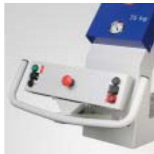
Operatørhåndtak VacuMaster Comfort