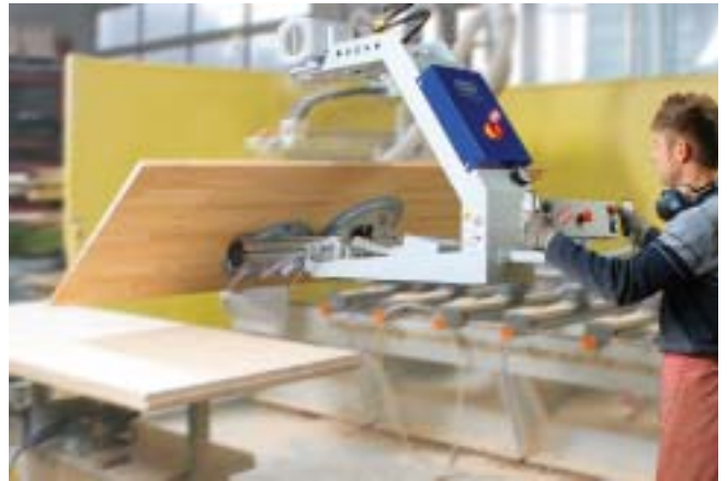
VacuMaster Comfort, 125 Kg, 180 grader vending av heltre plater inn og ut av CNC fres