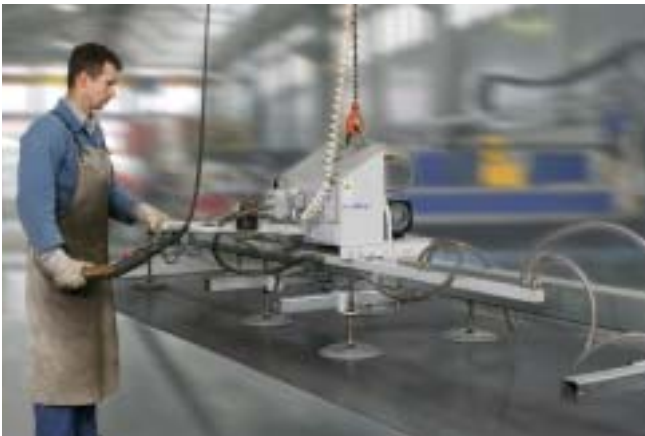
VacuMaster Vario, 1000 Kg, horisontal håndtering av av plate inn og ut av plasmakutter