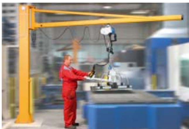
VacuMaster Basic, 250 Kg, horisontal håndtering av rustfrie plater