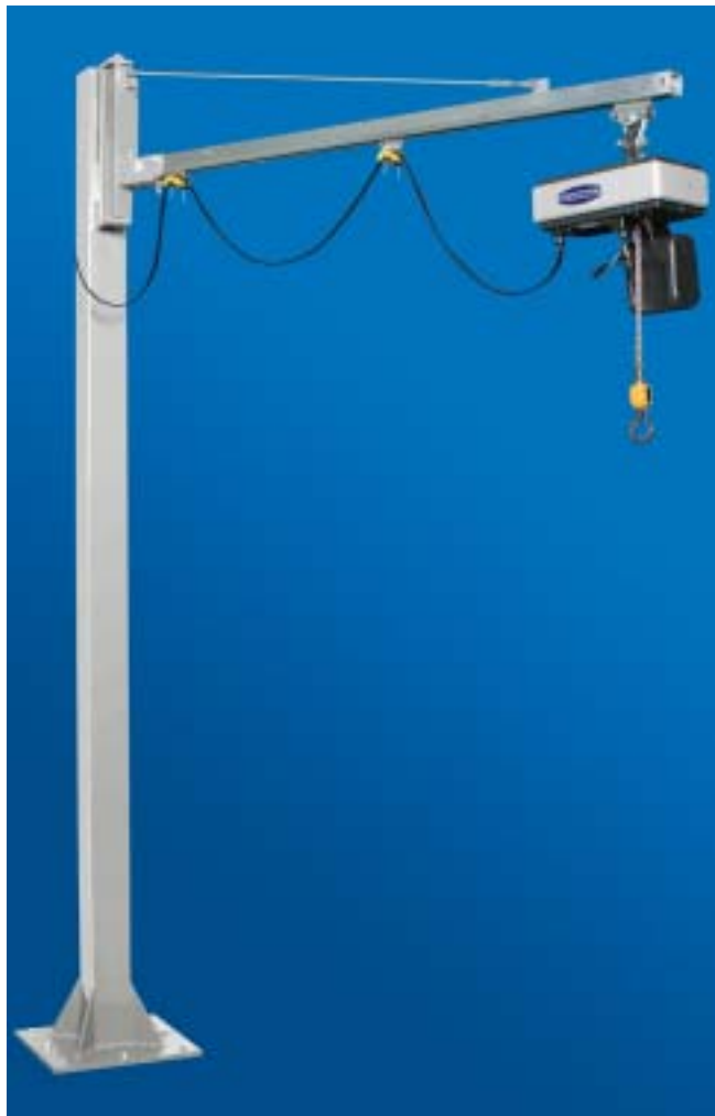
Søylesvingkran med elektrisk kjettingtalje

Kranløsninger med elektrotaljer komplementerer ditt vakuumløftesystem. Vi kan levere et stort utvalg utførelser og kapasiteter for å imøtekomme kundenes spesifikke behov. Velg mellom veggsvingkran, søylesvingkran eller lettbanetravers for maksimalt arbeidsområde