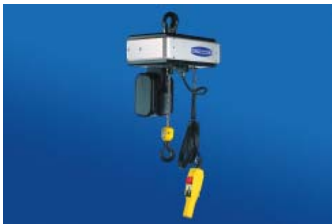
Elektrisk kjettingtalje, fås i forskjellige kapasiteter og utførelser